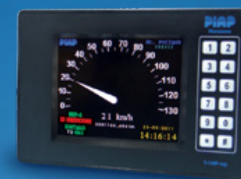
Kabinowy wskaźnik prędkości LCD z klawiaturą

Wskaźnik z wyświetlaczem LCD i klawiaturą umożliwia ekspozycję: daty, czasu oraz przebytej drogi, stanu wypełnienia EKP, numeru pociągu. Wskaźnik elektromechaniczny wskazuje jedynie prędkość pojazdu. Wszystkie wskaźniki mają możliwość zmiany jasności wyświetlania, dzięki czemu możliwe staje się dostosowanie ich jasności do panujących w kabinie warunków. Dla wypełnienia wszystkich funkcji, które posiada wskaźnik LCD z klawiaturą można obok wskaźnika elektromechanicznego zainstalować panel maszynisty.